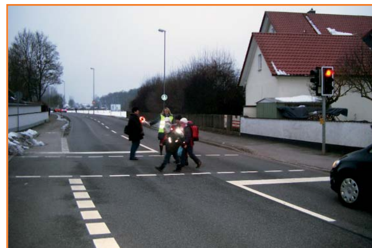
Fußgängerampel in der Kipfenberger Straße