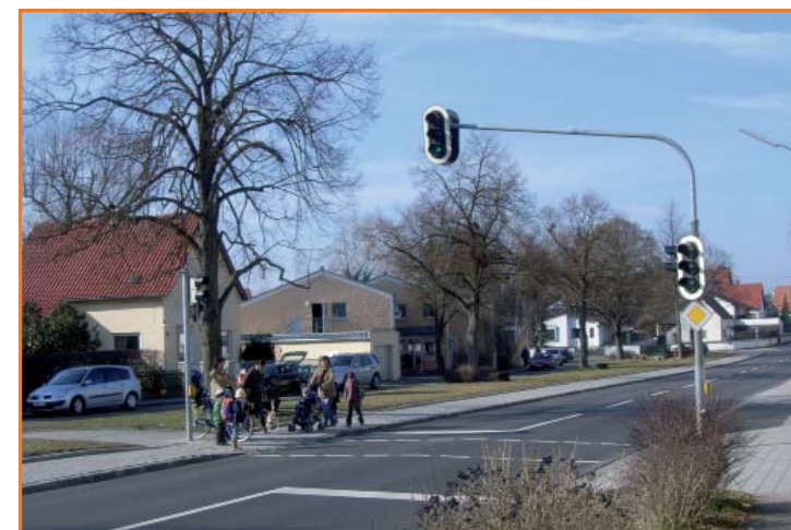
Fußgängerampel in der St.-Michael- Straße